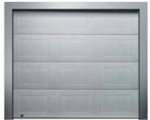
classico (nur in woodgrain)