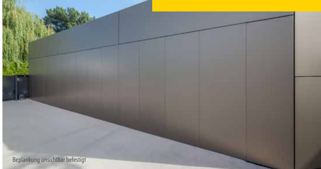
Beplankung unsichtbar befestigt