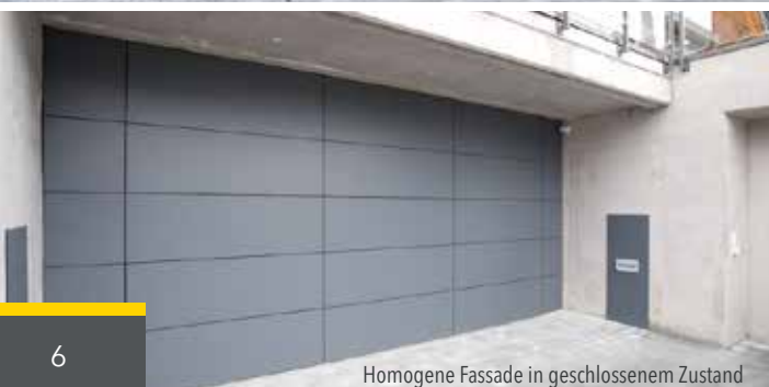
Homogene Fassade in geschlossenem Zustand