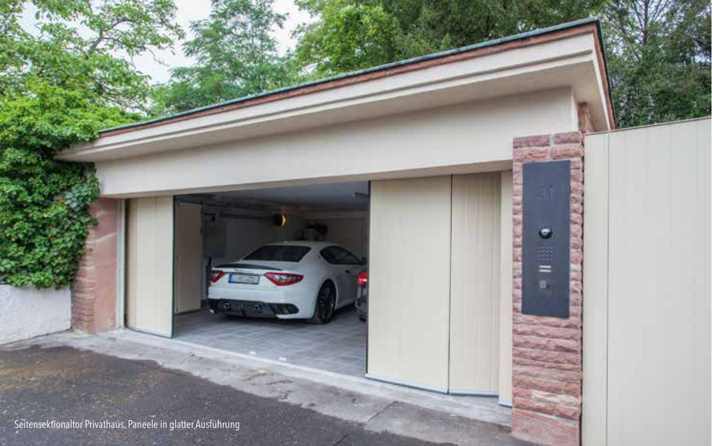
Seitensektionaltor Privathaus, Paneele in glatter Ausführung