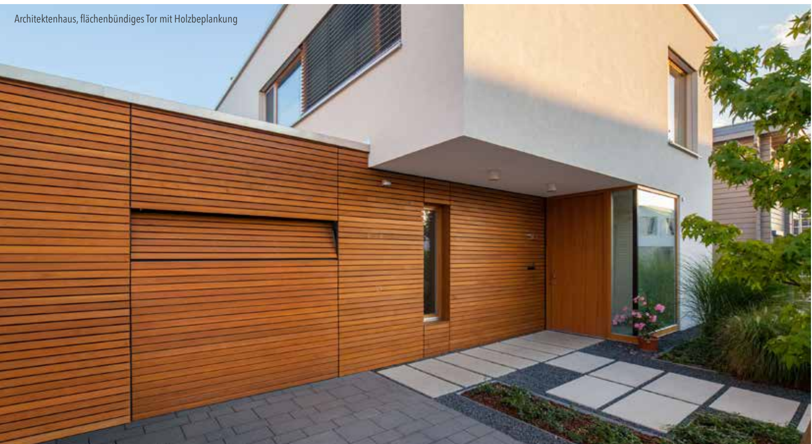
Architektenhaus, flächenbündiges Tor mit Holzbeplankung