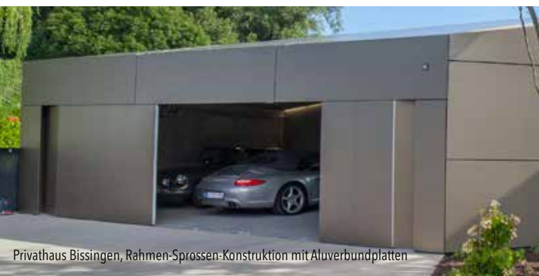
Privathaus Bissingen, Rahmen-Sprossen-Konstruktion mit Aluverbundplatten