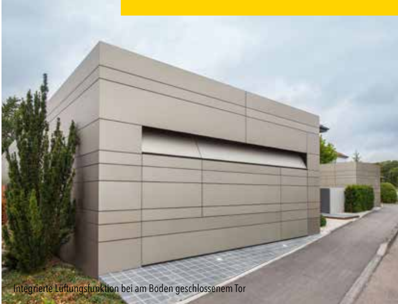
Integrierte Lüftungsfunktion bei am Boden geschlossenem Tor