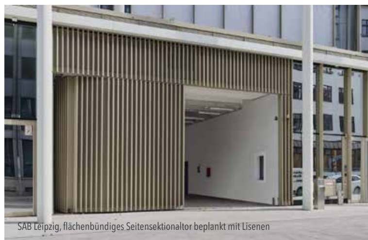
SAB Leipzig, flächenbündiges Seitensektortor beplankt mit Lisenen