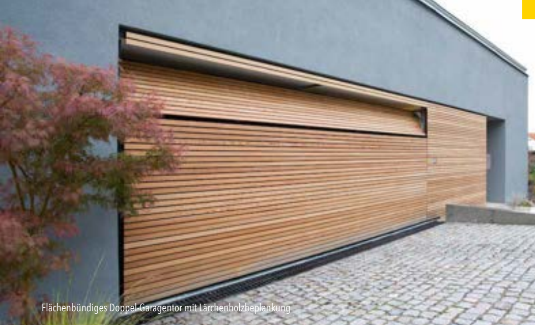
Flächenbündiges Doppel-Garagentor mit Lärchenholzbeplankung