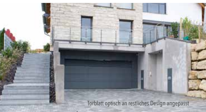
Torblatt optisch an restliches Design angepasst

Im Projekt, welches unterhalb dargestellt ist, lieferte BeluTec ein ca. 5000 x 2200 mm großes flächenbündiges Sektionaltor. Das Tor besteht aus einer Aluminium-Rahmen-Sprossen-Konstruktion mit ausgeschäumten Stahl-Sandwich-Paneelen. Aufgeteilt ist das Torblatt in der Breite in drei Felder und in der Höhe in vier Sektionen. Es wurde für die Aufnahme einer bauseitigen Beplankung von 10 mm Trespa und 20 mm Lattung vorbereitet. Die oberste Sektion des flächenbündigen Sektionaltores wurde als Kippflügel zur Be- und Entlüftung ausgeführt.