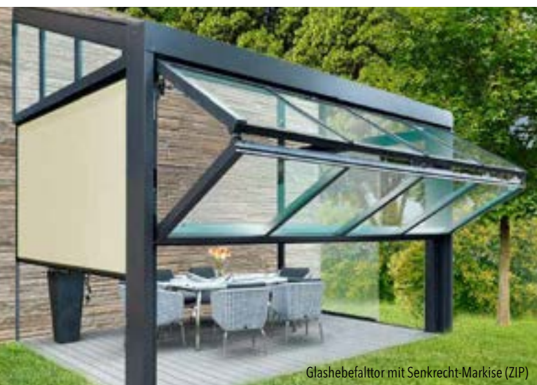
Glashebelgtor mit Senkrecht-Markise (ZIP)