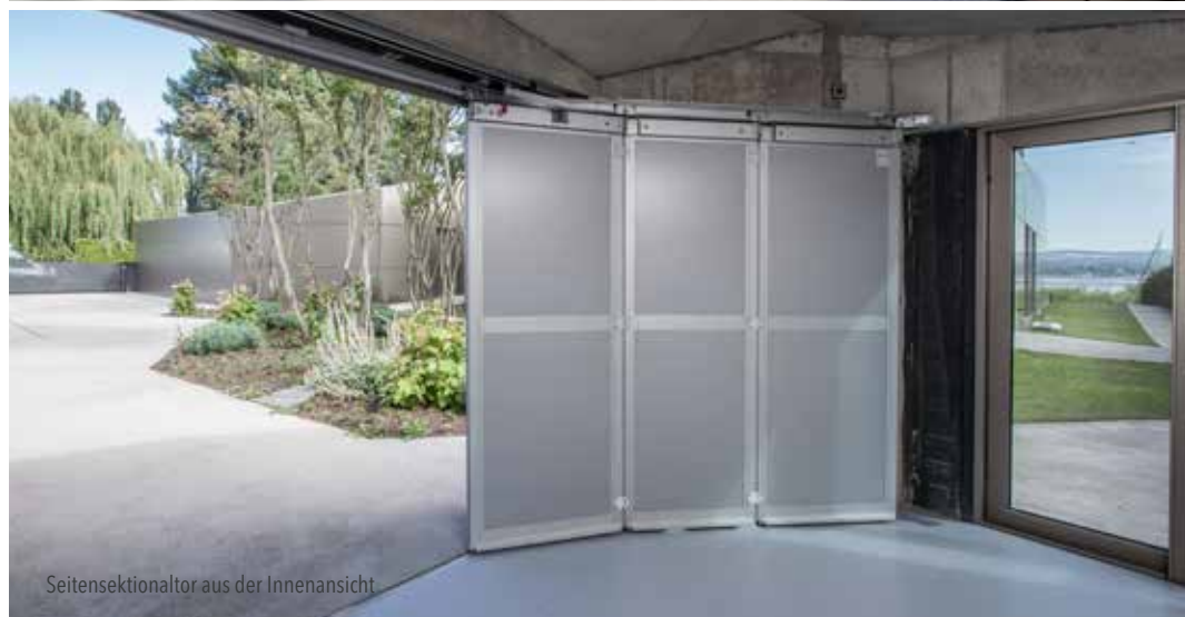
Seitensektionaltor aus der Innenansicht