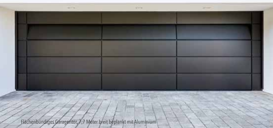
Flächenbündiges Garagentor, 7,7 Meter breit beplankt mit Aluminium