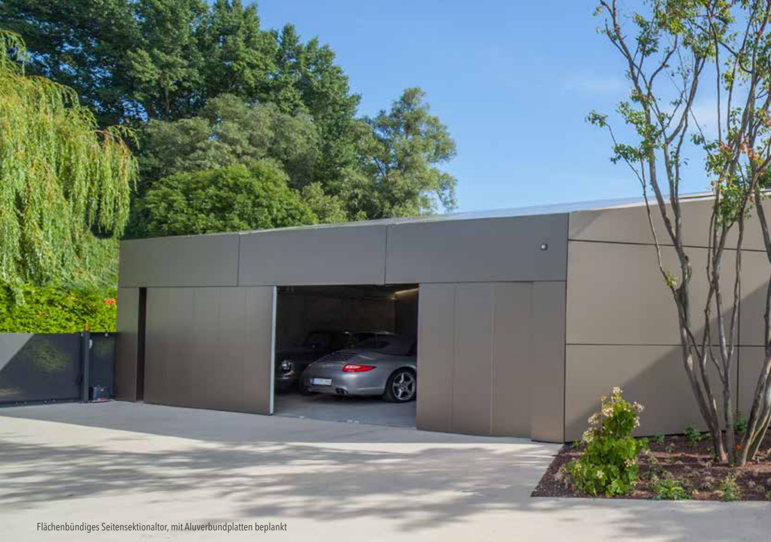
Flächenbündiges Seitensektionaltor, mit Aluverbundplatten beplankt