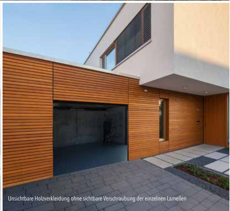
Unsichtbare Holzverkleidung ohne sichtbare Verschraubung der einzelnen Lamellen