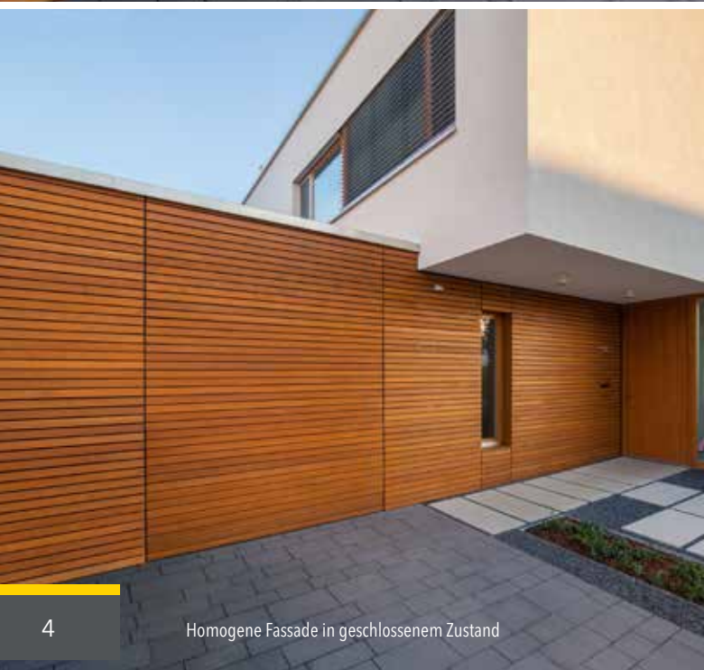
Homogene Fassade in geschlossenem Zustand