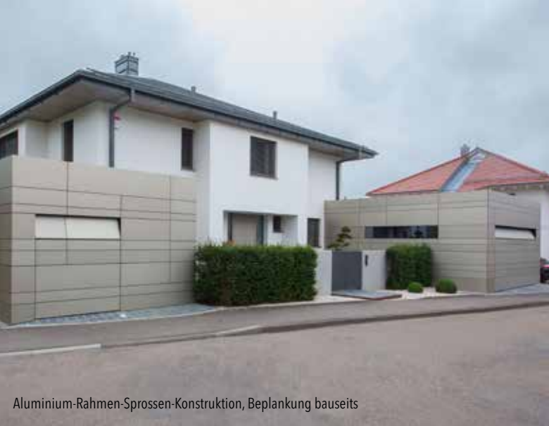
Aluminium-Rahmen-Sprossen-Konstruktion, Beplankung bauseits